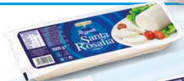
566 MOZZARELLA SANTA ROSALIA KG 1 12 pz. per cart.