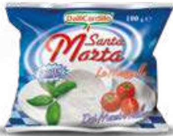
517 MOZZARELLA FROZEN SANTA MARTA G 100 40 pz. per cart.