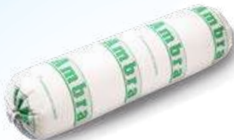
604 P.A. AMBRA KG 2 5 pz. per cart.