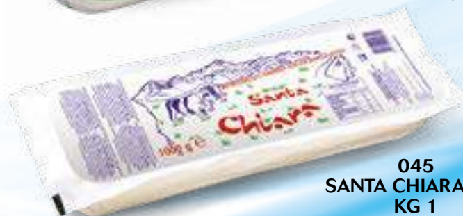
045 SANTA CHIARA MIX KG 1 12 pz. per cart.