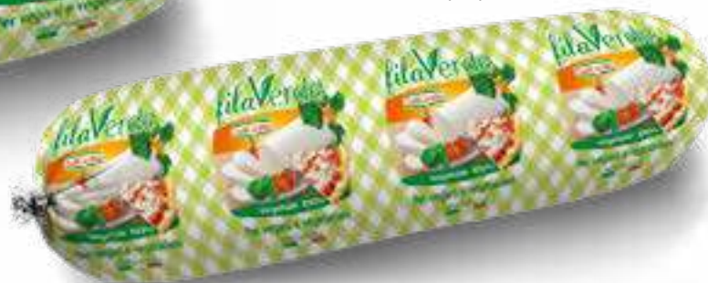
664 FILAVERDE G 400 14 pz. per cart.