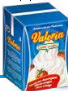
027 SEM. PASTICCERIA VALERIA ML 500 12 pz. per cart.