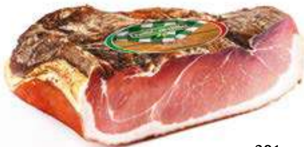
126 SPECK 1/2 SV peso variabile circa KG 2,6 4 pz. per cart.