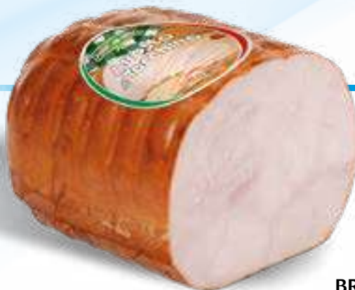
124 ARROSTO DI TACCHINO 1/2 SV peso variabile circa KG 4,5 3 pz. per cart.