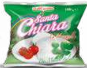
511 MOZZARELLA SANTA CHIARA G 100 40 pz. per cart.