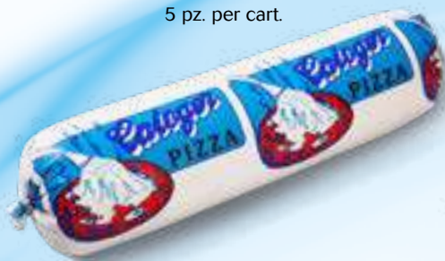
601 P.A. BLU KG 2 5 pz. per cart.