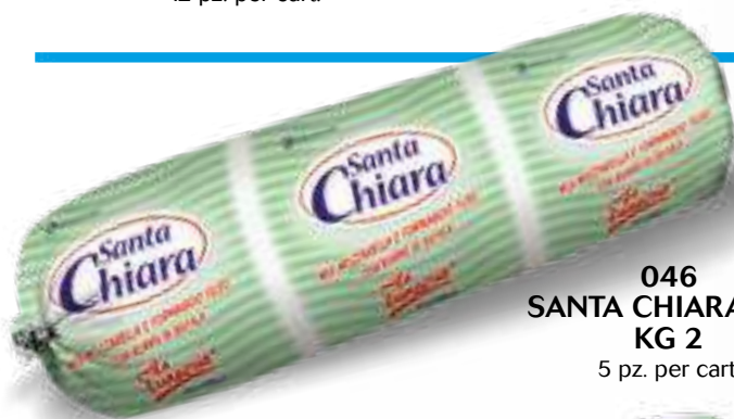
046 SANTA CHIARA MIX KG 2 5 pz. per cart.