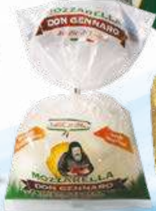
502 MOZZ. DI BUFALA G 250 8 pz. per cart.