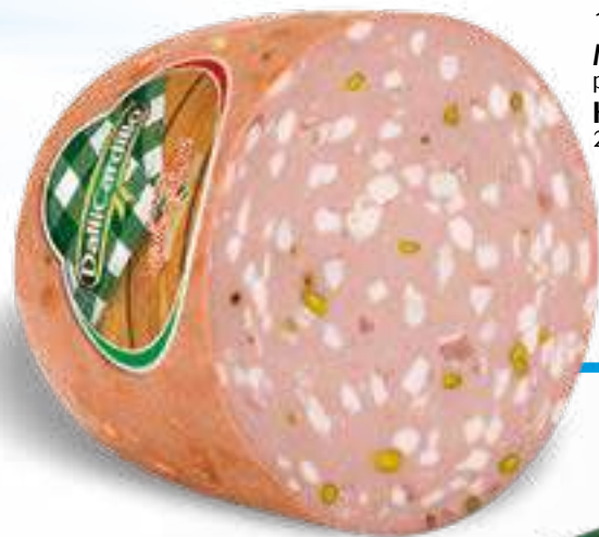
100 MORTADELLA peso variabile circa KG 7 2 pz. per cart.