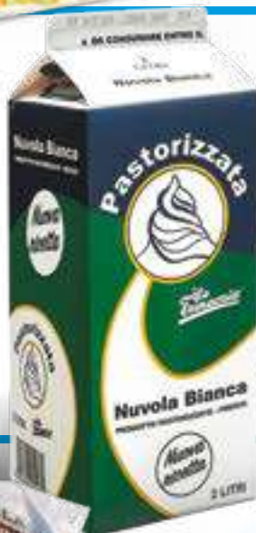
070 SPECIALITÀ ALIMENTARE UHT NUVOLA BIANCA LT 2 6 pz. per cart.