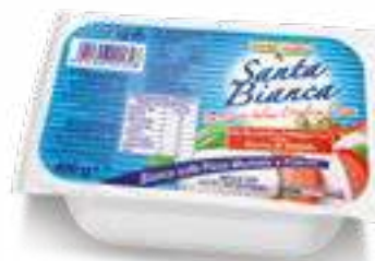
019 MIX SANTA BIANCA G 400 12 pz. per cart.