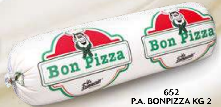
652 P.A. BONPIZZA KG 2 FROZEN 5 pz. per cart.