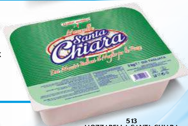
513 MOZZARELLA SANTA CHIARA VERDE SFIL./CUB. KG 3 4 pz. per cart.