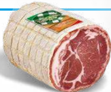
123 PANCETTA COPPATA 1/2 SV peso variabile circa KG 2,8 4 pz. per cart.

1 LOMBO 2 pz. per cart. 2 LOMBI 1 pz. per cart.