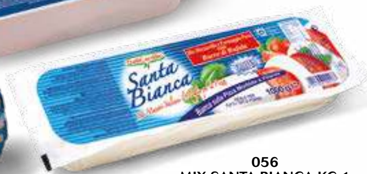
056 MIX SANTA BIANCA KG 1 FROZEN 12 pz. per cart.