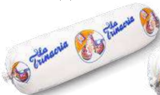
610 P.A. TRINACRIA KG 2 5 pz. per cart.