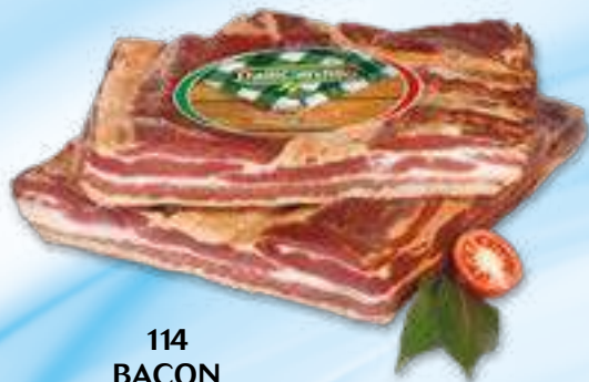
114 BACON peso variabile circa KG 2,5 6 pz. per cart.