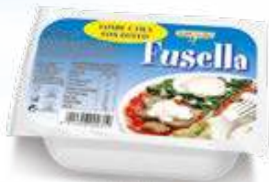
040 F. FUSO FUSELLA G 400 12 pz. per cart.