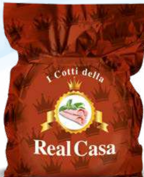
181 COTTO REAL CASA MARRONE peso variabile circa KG 8,5 2 pz. per cart.