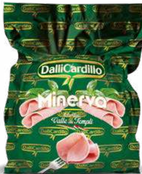
102 COTTO MINERVA peso variabile circa KG 8,5 2 pz. per cart.