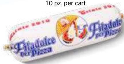
627 P.A. FILADOLCE ESTATE KG 1 10 pz. per cart.