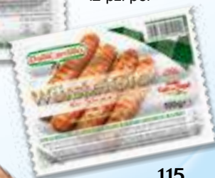
115 WÜRSTEL 4x100 g 30 pz. per cart.