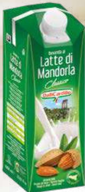
702 LATTE DI MANDORLA ORO LT 1 12 pz. per cart.