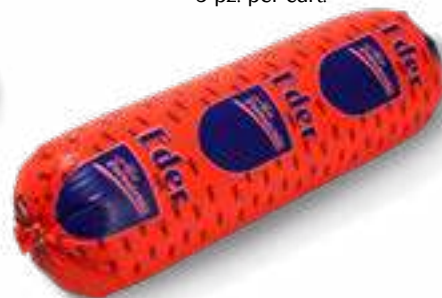
606 P.A. EDER KG 2 5 pz. per cart.