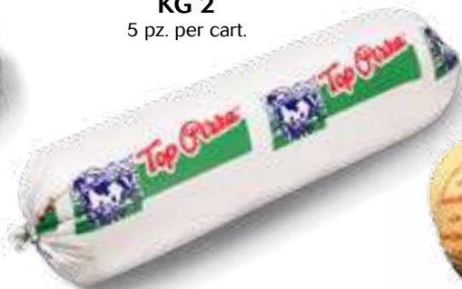
014 F. FUSO TOP PIZZA KG 2 5 pz. per cart.