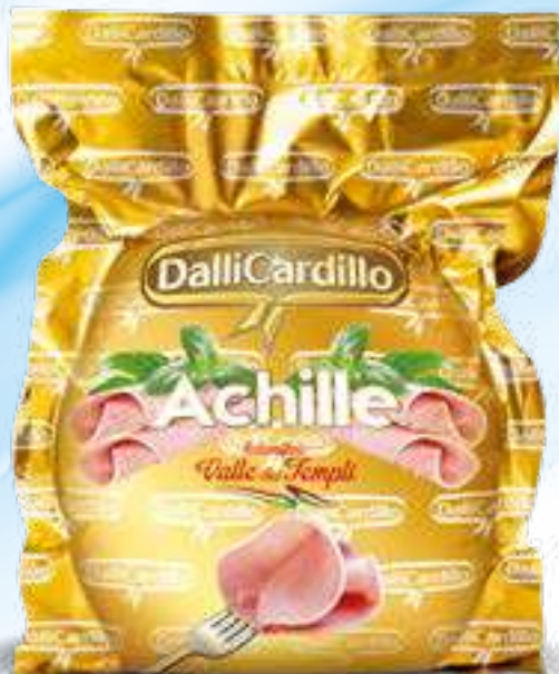
129 COTTO SGRASSATO ACHILLE peso variabile circa KG 8,5 2 pz. per cart.