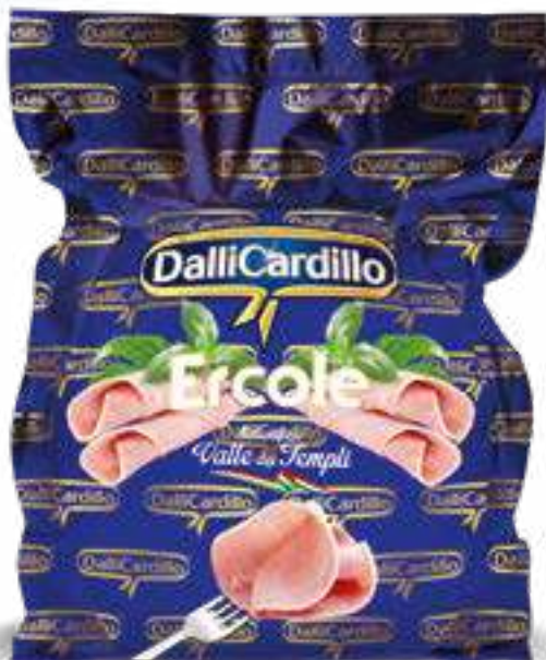
121 PROSCIUTTO COTTO ERCOLE peso variabile circa KG 8,5 2 pz. per cart. ERCOLE A METÀ 3 pz. per cart.