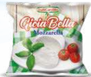
570 MOZZARELLA GIOIA BELLA G 250 24 pz. per cart.