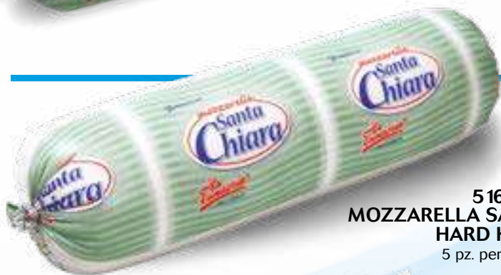
516 MOZZARELLA SANTA CHIARA HARD KG 2 5 pz. per cart.