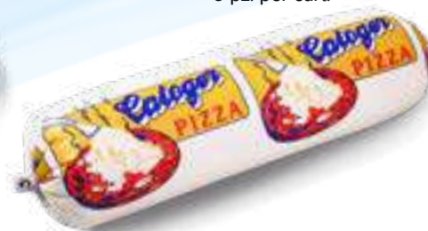
603 P.A. ORO KG 2 5 pz. per cart.