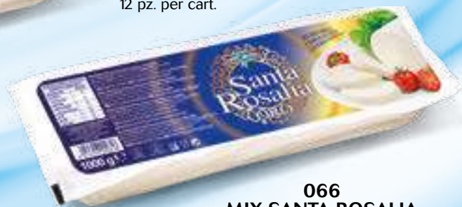
066 MIX SANTA ROSALIA ORO KG 1 12 pz. per cart.