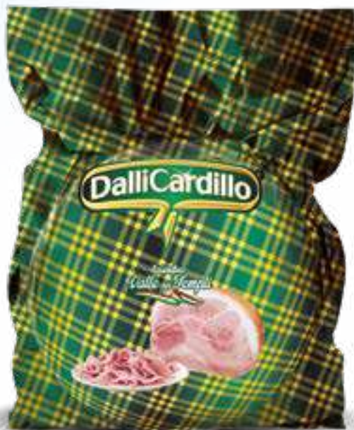
128 PROSCIUTTO COTTO ALTA QUALITÀ EROS peso variabile circa KG 8,5 2 pz. per cart.