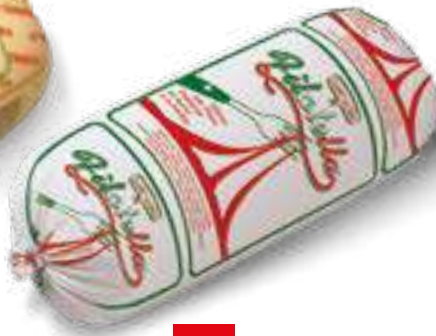
FF01 F. FUSO FILATELLA FORCHETTA KG 2 5 pz. per cart.