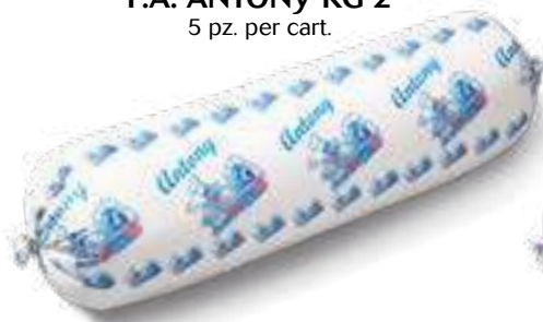
630 P.A. ANTONY KG 2 5 pz. per cart.