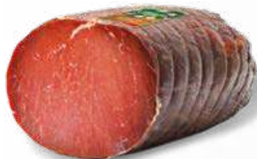
104 BRESAOLA peso variabile circa KG 1,3 4 pz. per cart.