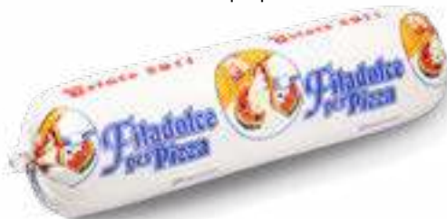
618 P.A. FILADOLCE ESTATE KG 2 5 pz. per cart.