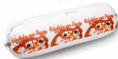
625 P.A. FILADOLCE ROSSA KG 2 5 pz. per cart.