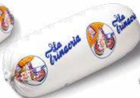
611 P.A. TRINACRIA KG 2,5 4 pz. per cart.