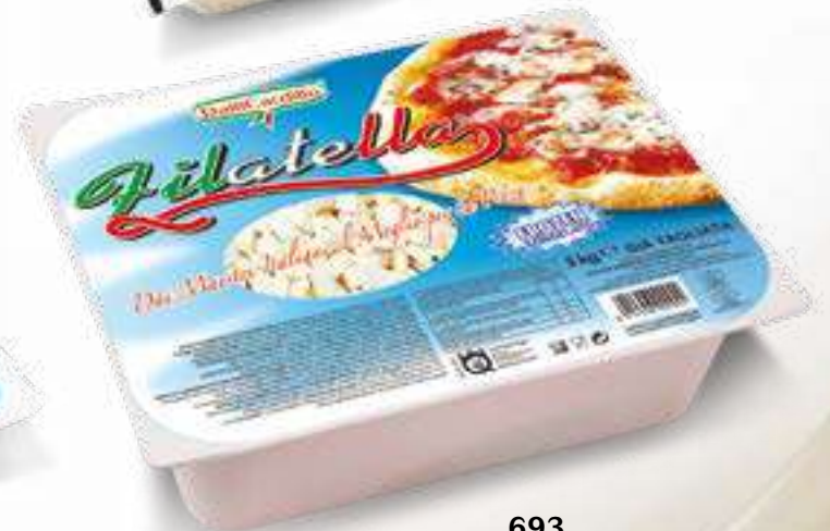
693 S.A. FILATELLA CUB. KG 3 FROZEN 4 pz. per cart.