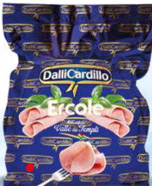
131 PROSCIUTTO COTTO ERCOLE BOLLINO ROSSO peso variabile circa KG 8,5 2 pz. per cart. ERCOLE BOLLINO ROSSO A METÀ 3 pz. per cart.