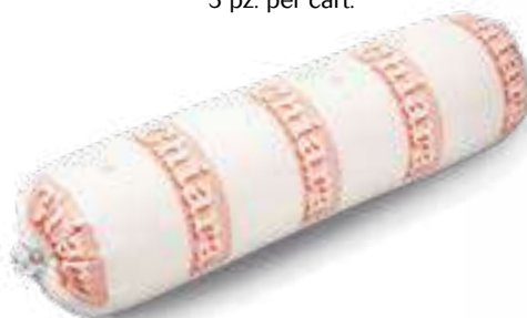
605 P.A. CHIARA KG 2 5 pz. per cart.