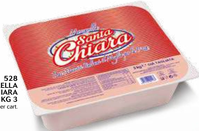
528 MOZZARELLA SANTA CHIARA ROSSA SFIL./CUB. KG 3 4 pz. per cart.