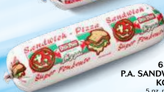
634 P.A. SANDWICH PIZZA KG 2 5 pz. per cart.