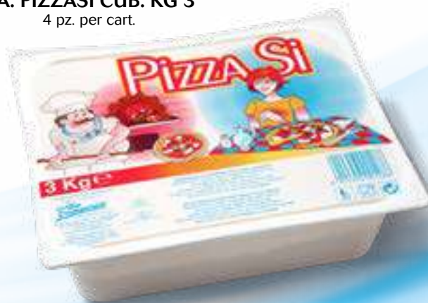
PA02 P.A. PIZZASI CUB. KG 3 4 pz. per cart.