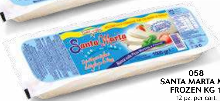
058 SANTA MARTA MIX FROZEN KG 1 12 pz. per cart.