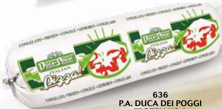
636 P.A. DUCA DEI POGGI FROZEN KG 2 5 pz. per cart.