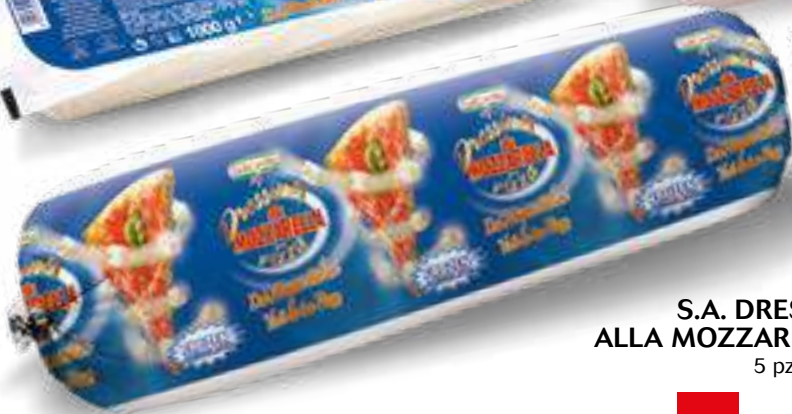
656 S.A. DRESSING PIZZA ALLA MOZZARELLA KG 2 FROZEN 5 pz. per cart.