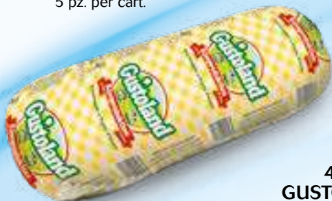
412 GUSTOLAND KG 2 5 pz. per cart.