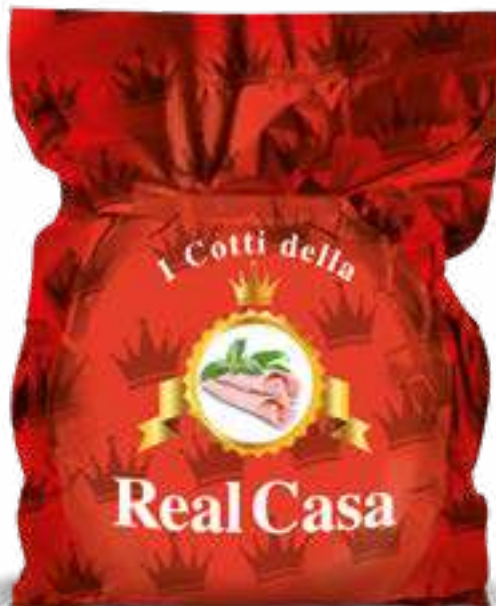
185 PROSCIUTTO COTTO SCELTO REAL CASA ROSSO peso variabile circa KG 8,5 2 pz. per cart.