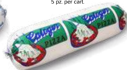
623 P.A. CALOGER VERDE KG 2 5 pz. per cart.