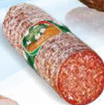
107 SALAME UNGHERESE peso variabile circa KG 3 6 pz. per cart.