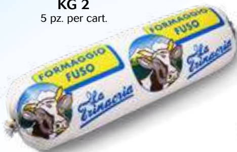
004 F. FUSO TRINACRIA KG 2 5 pz. per cart.