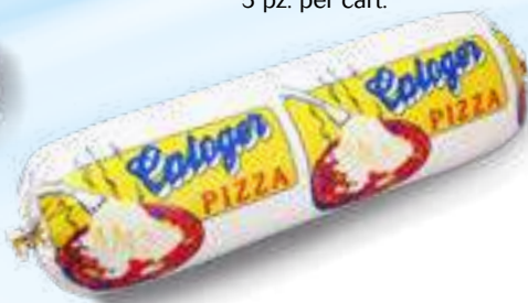
602 P.A. GIALLO KG 2 5 pz. per cart.