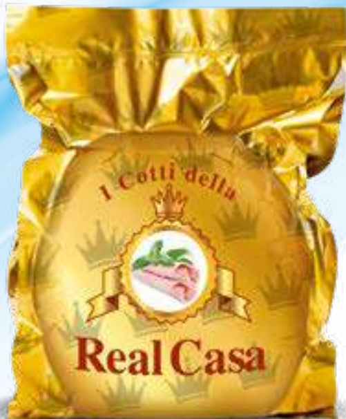
182 COTTO REAL CASA ORO peso variabile circa KG 8,5 2 pz. per cart.