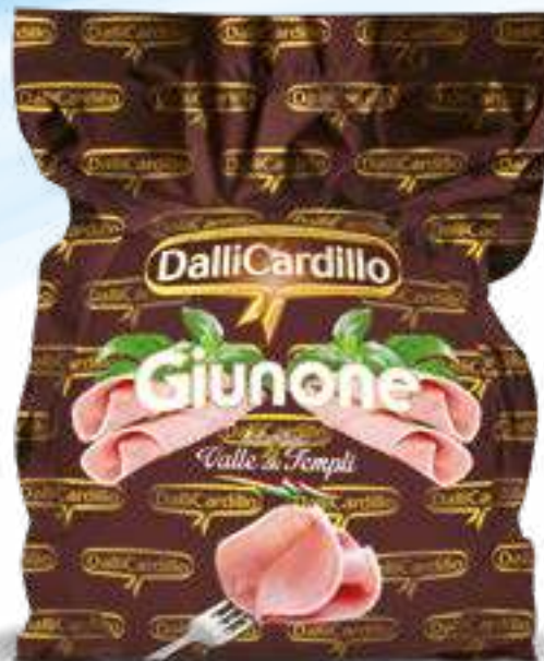
120 COTTO GIUNONE peso variabile circa KG 8,5 2 pz. per cart.