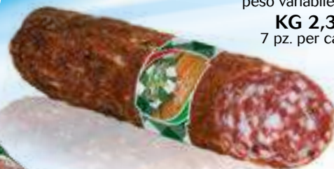
105 SALAME NAPOLI peso variabile circa KG 2,3 7 pz. per cart.