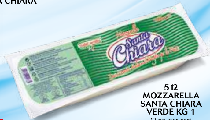
512 MOZZARELLA SANTA CHIARA VERDE KG 1 12 pz. per cart.