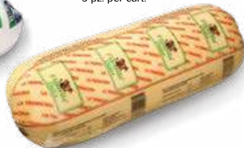
022 FUSO FILATELLA DOLCE KG 2 5 pz. per cart.