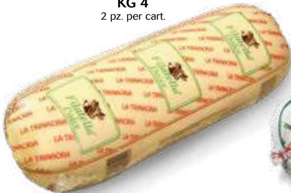
024 FUSO FILATELLA DOLCE KG 4 2 pz. per cart.