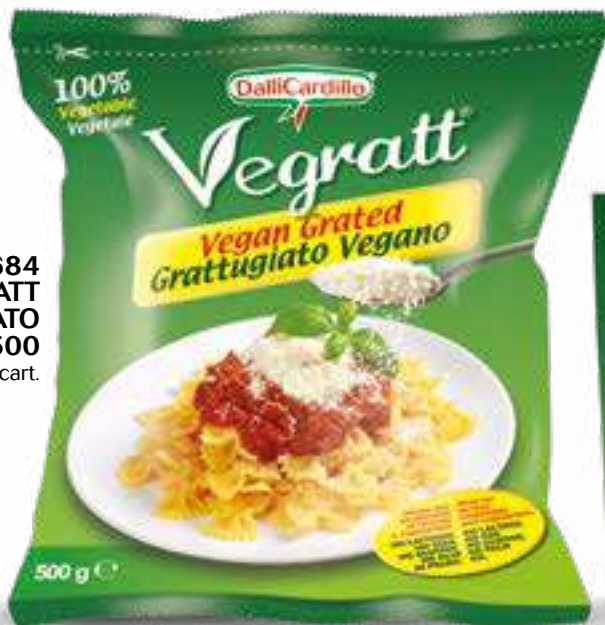
684 S.A. VEGRATT GRATTUGIATO BUSTA G 500 6 pz. per cart.