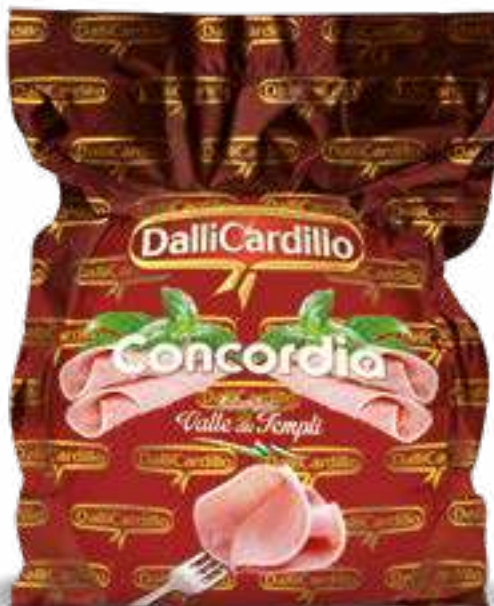
122 PROSCIUTTO COTTO SCELTO CONCORDIA peso variabile circa KG 8,5 2 pz. per cart.