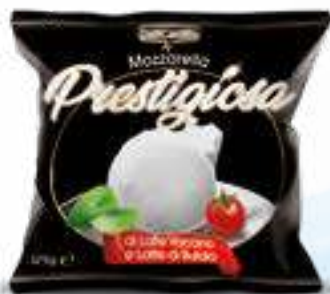
542 MOZZARELLA CON LATTE DI BUFALA PRESTIGIOSA G 125 40 pz. per cart.