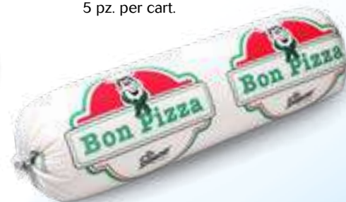
635 P.A. BONPIZZA KG 2 5 pz. per cart.