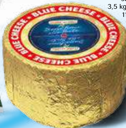
002 BLUE CHEESE peso variabile circa KG 3 2 pz. per cart.