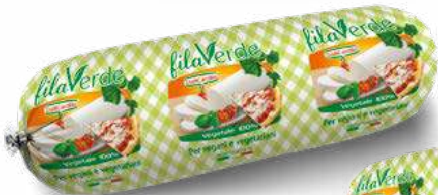
661 FILAVERDE KG 1 10 pz. per cart.